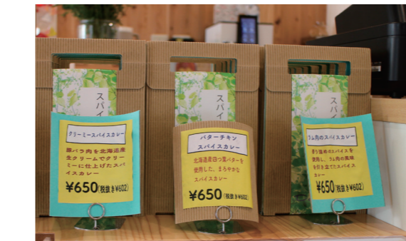
レトルトカレー3種類。それぞれ、個性的な美味しさです。全部楽しみたい方は、お得な3種セットがおすすめ。

皆さんに食べてもらいたいやすい様にとの優しい思いが詰まった辛さ控えめのカレーは、添加物を一切使わないので、子どもでもおいしく食べられる、体にやさしい・おいしいスパイスカレーです。(キッズカレーもあります) 素材のうま味と塩だけで仕上げたカレーは、定番のチキンバターと季節の素材を使った3種類の日替わりカレーがあり、合計で4種類のカレーメニューがあります。 その中でも、優しい味わいで食べやすいチキンバターカレーが一番人気ですが、季節によって異なる日替わりメニューもおすすめです。 一番のおすすめメニューは4種盛りカレーです。