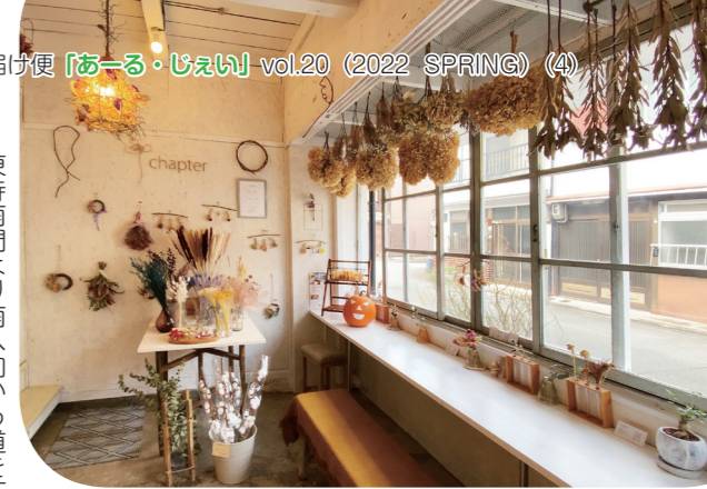
色々なドライフラワーが楽しめるカフェスペースは、近所の方の憩いの場所にもなっています。

東寺南門より南へ向かう道を下り一筋目を東に、昭和頃の建物が並ぶ住宅街に、間口が白い建物があります。東寺さんと南区役所との中間あたりに、国道から一筋入っただけで、車の喧嘩もなく静かな街並み。馴染みよく落ち着いた様子を見せながら「chapter」はあります。外から揺らぎの有るガラスを使用した窓