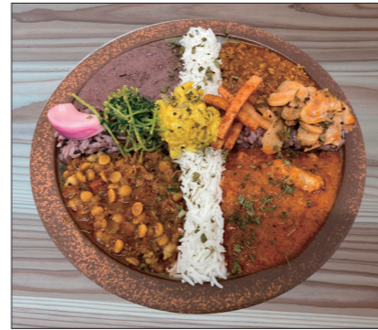
おすすめの4種盛りカレー。こだわりの色々なカレーが一度に味わえるお得メニュー。

1月22日は「カレー記念日」。1985年の1月22日に学校給食で全国の小中学校にカレーの提供が呼びかけられた日にちなみ、制定された記念日だそうです。国民食になったカレーですが、最近京都ではスパイスカレーのお店が急増中。お店ごとに独自にブレンドされたスパイスが楽しめるため、いろいろなお店を巡るファンも多くいます。独特の辛さと甘さ、コクのある深い味わいや、クセになるスパイスなどの特徴があるなかで、今回は、南区にあるスパイスカレーのお店を紹介いたします。